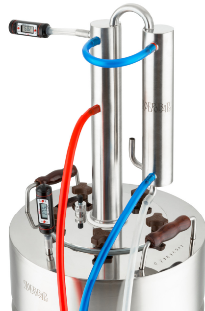
Рис. 3. Подключение аппарата в режиме укрепления