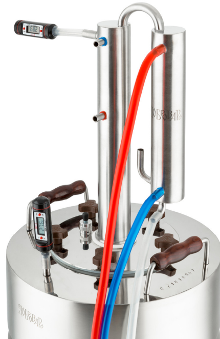
Рис. 2. Подключение аппарата в режиме дистилляции